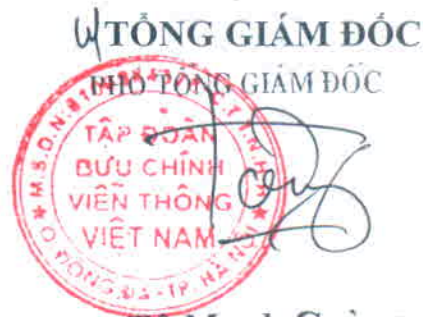
Tô Mạnh Cường